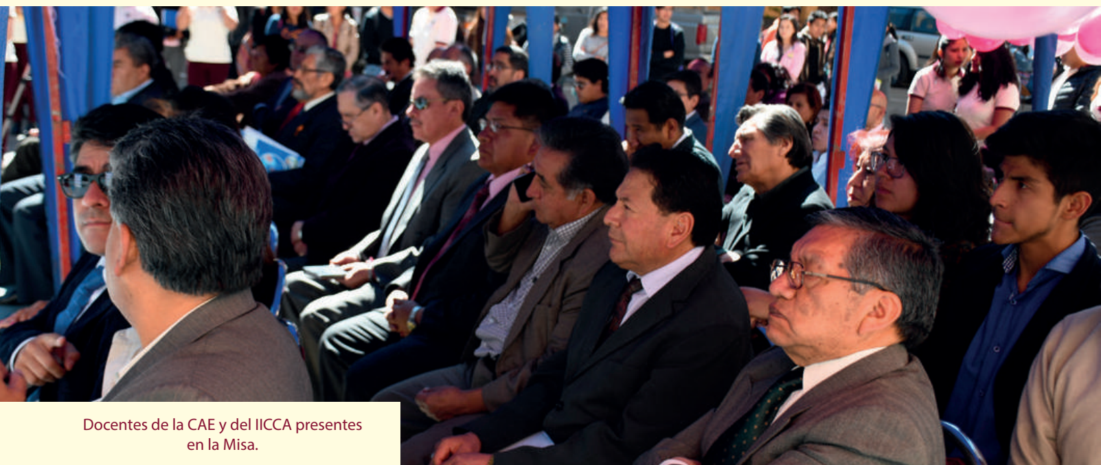
Docentes de la CAE y del IICCA presentes en la Misa.