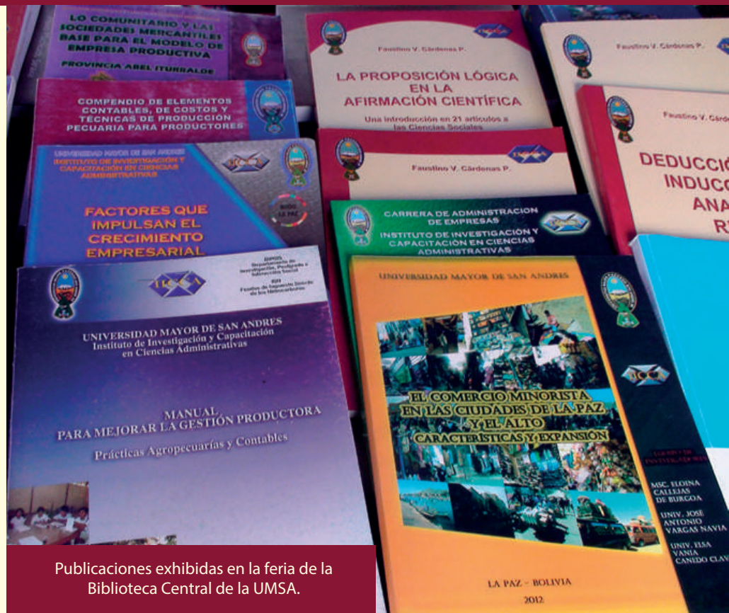
Publicaciones exhibidas en la feria de la Biblioteca Central de la UMSA.