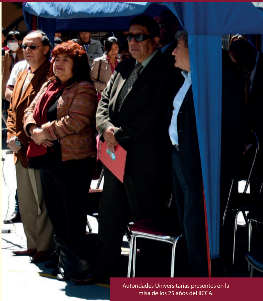
Autoridades Universitarias presentes en la misa de los 25 años del IICCA.

El IICCA fue creado mediante Resolución Nro. 056/93, del Honorable Consejo Universitario de la Universidad Mayor de San Andrés (UMSA), un 15 de abril de 1993. Es una unidad académica de la Carrera de Administración de Empresas, de la Facultad de Ciencias Económicas y Financieras, encargada de desarrollar programas de investigación, interacción social, capacitación y postgrados.