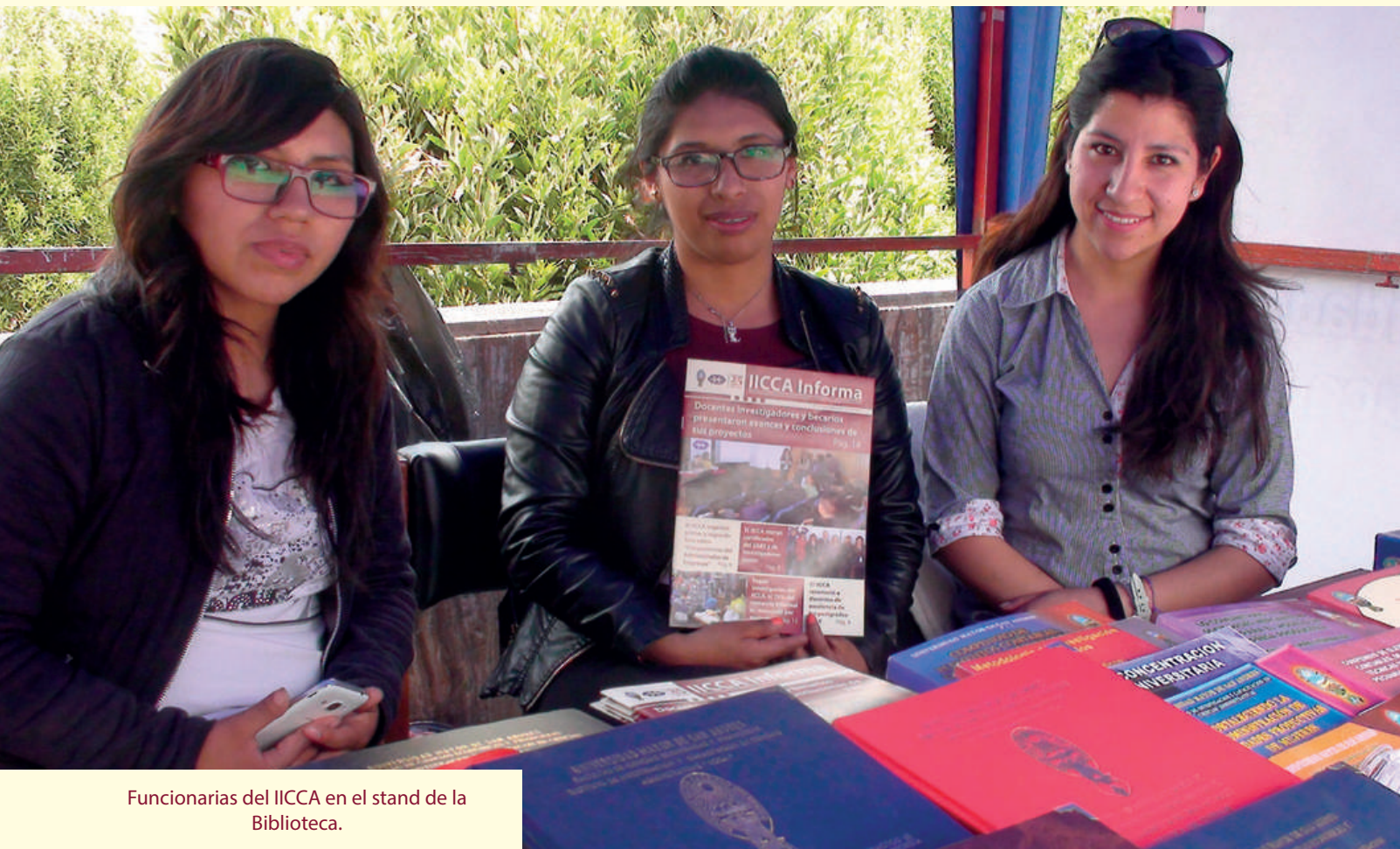
Funcionarias del IICCA en el stand de la Biblioteca.