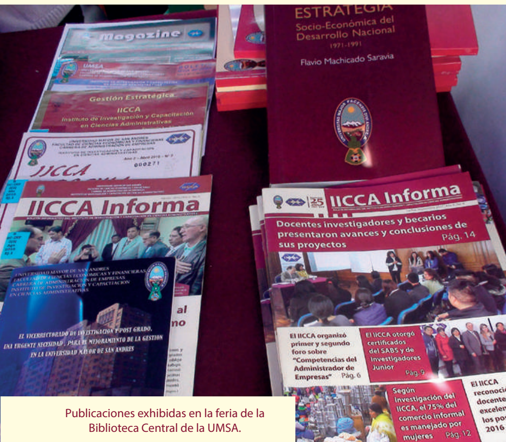
Publicaciones exhibidas en la feria de la Biblioteca Central de la UMSA.

Todas las publicaciones pueden ser consultadas por el público en general en la Biblioteca del IICCA.