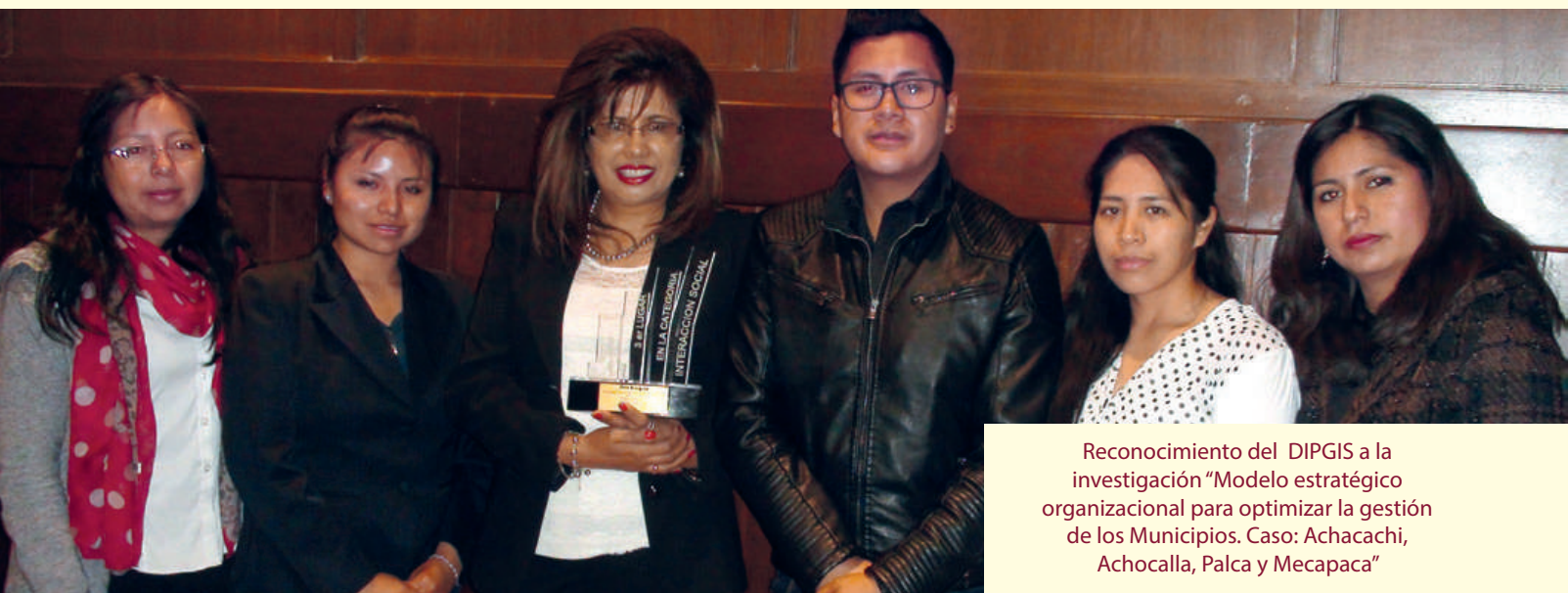
Reconocimiento del DIPGIS a la investigación “Modelo estratégico organizacional para optimizar la gestión de los Municipios. Caso: Achacachi, Achocalla, Palca y Mecapaca”

“EsTuFeria” es una exposición anual organizada por el Departamento de Investigación, Postgrado e Interacción Social (DIPGIS), de la UMSA, con el objetivo de socializar los resultados de investigaciones, innovaciones e interacciones sociales de sus 13 facultades.