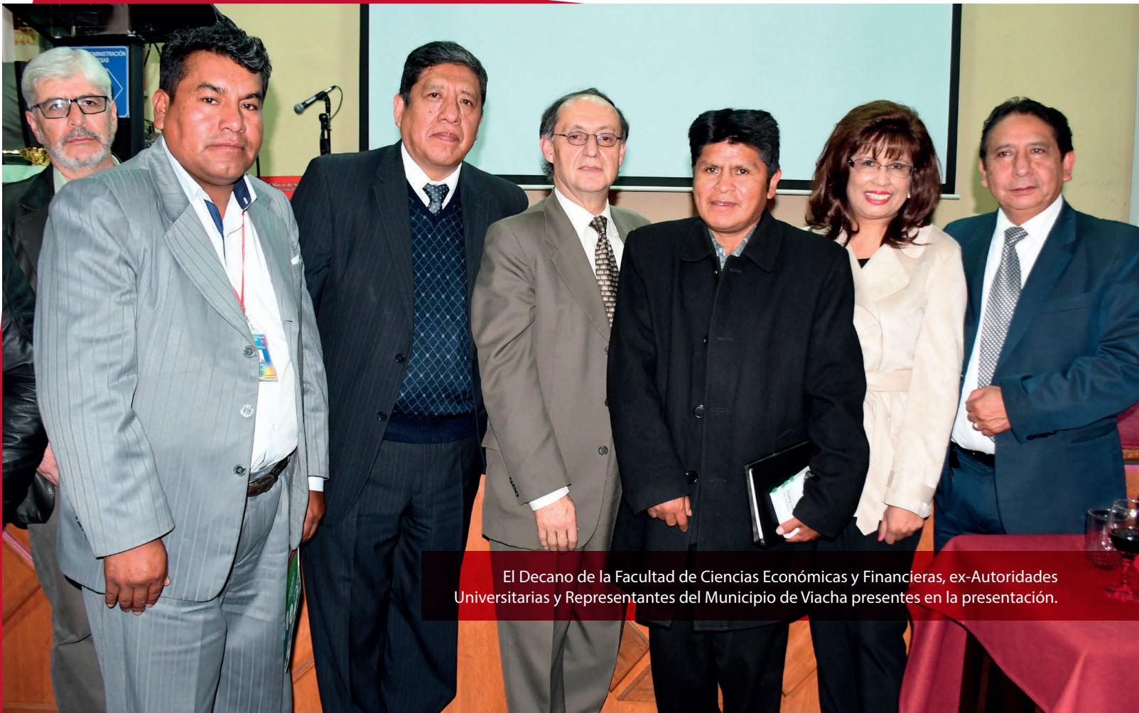
El Decano de la Facultad de Ciencias Económicas y Financieras, ex-Autoridades Universitarias y Representantes del Municipio de Viacha presentes en la presentación.

“Hemos llegado a este municipio que nos ha abierto las puertas, pero no ha sido fácil. Hemos obtenido un resultado satisfactorio, por esta razón existe el interés de otros Distritos para que se desarrolle este mismo estudio en sus subalcaldías, pero con un enfoque más productivo, por lo cual hemos firmado un convenio para seguir apoyando al municipio de Viacha”, destacó la ex autoridad del IICCA.