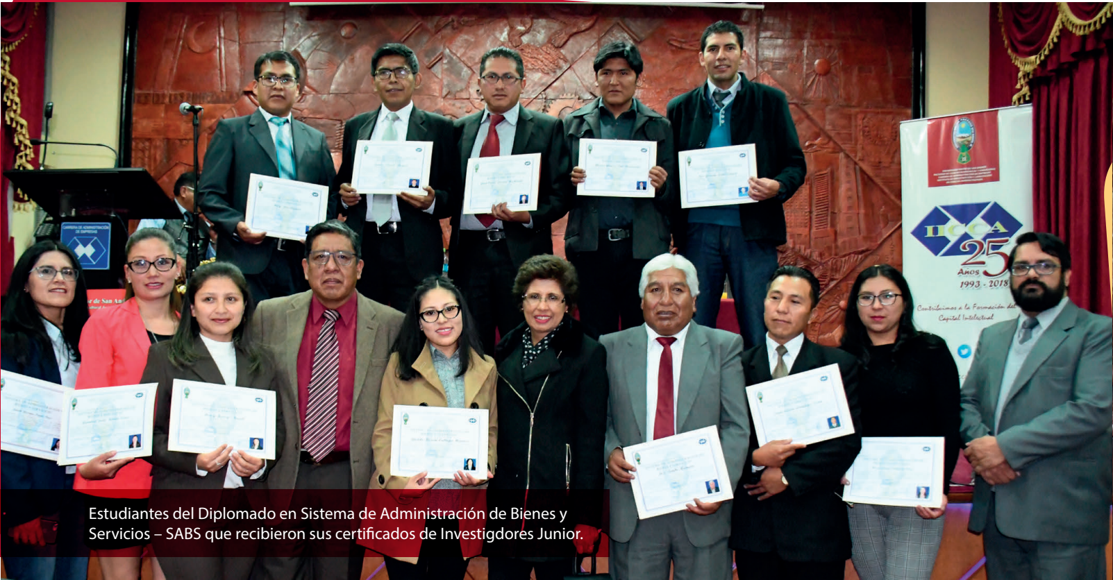
Estudiantes del Diplomado en Sistema de Administración de Bienes y Servicios – SABS que recibieron sus certificados de Investigadores Junior.