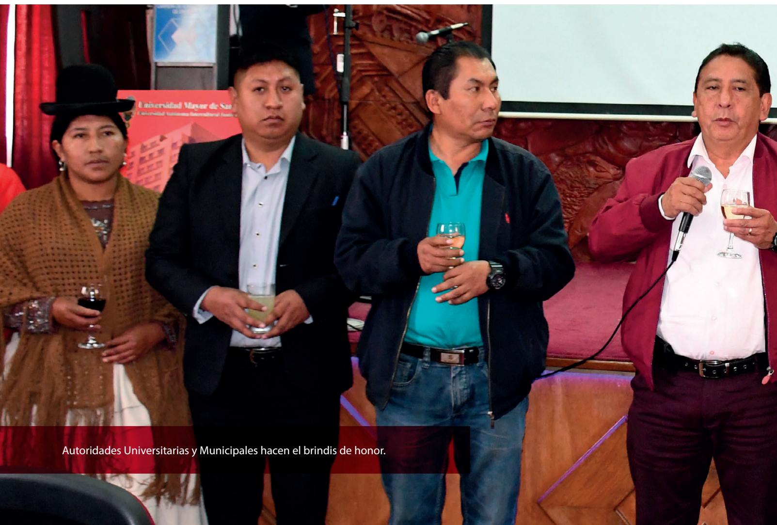
Autoridades Universitarias y Municipales hacen el brindis de honor.

La metodología utilizada en la investigación fue cuantitativa y cualitativa, seleccionando una muestra de la población con la ayuda de las alcaldías, para realizar encuestas a ciudadanos, organizaciones sociales, servidores públicos, funcionarios del sector