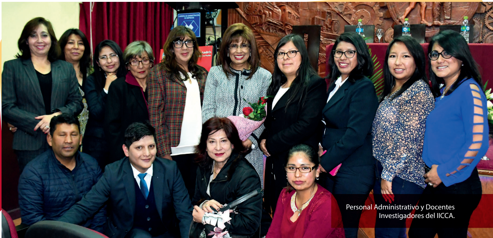
Personal Administrativo y Docentes Investigadores del IICCA.