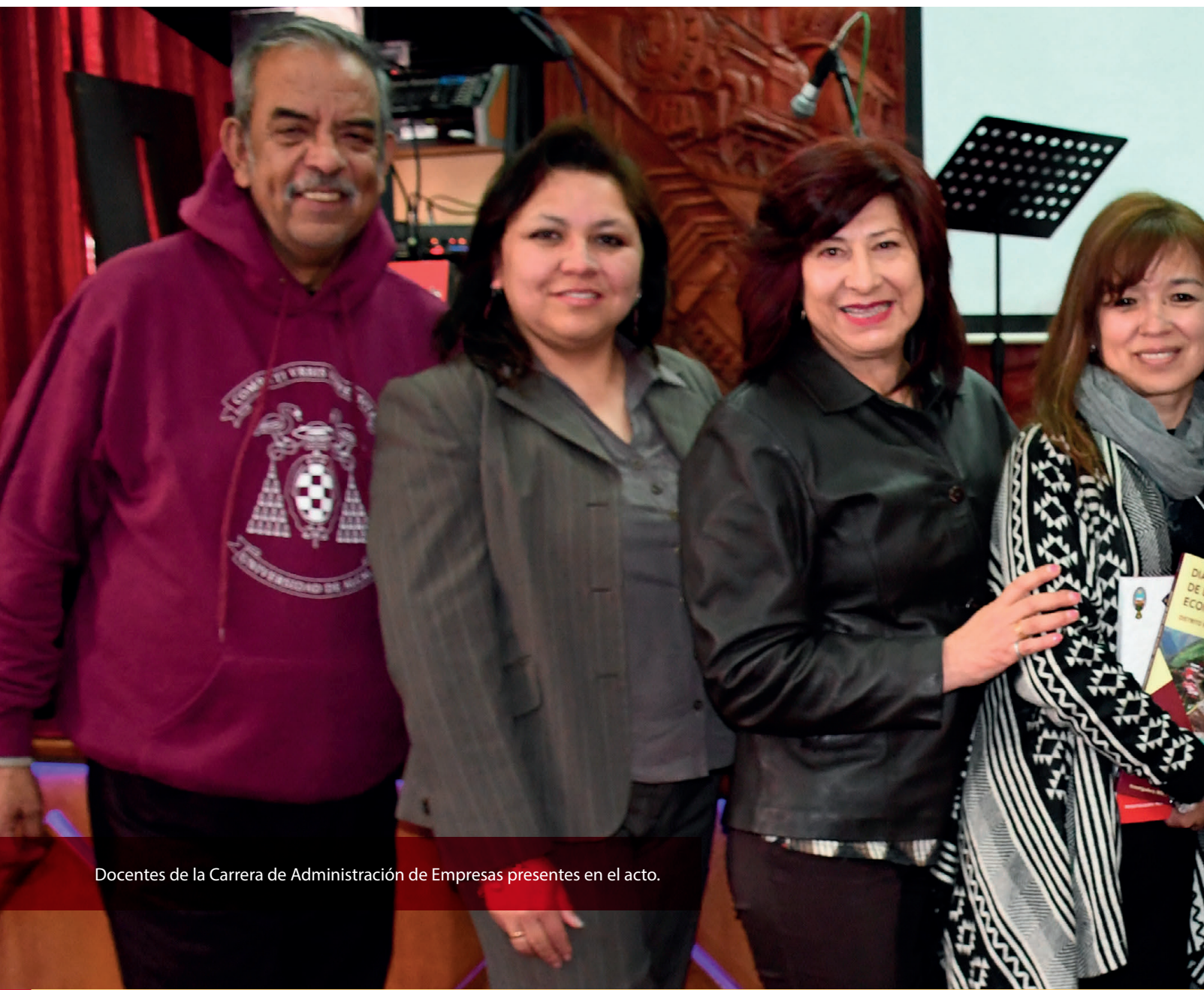
Docentes de la Carrera de Administración de Empresas presentes en el acto.

Los estudios diagnosticaron los procesos productivos e identificaron las vocaciones productivas de las regiones del Valle de Zongo y Hampaturi considerando sus aptitudes, identidad y capacidad de producción agrícola y ganadera,