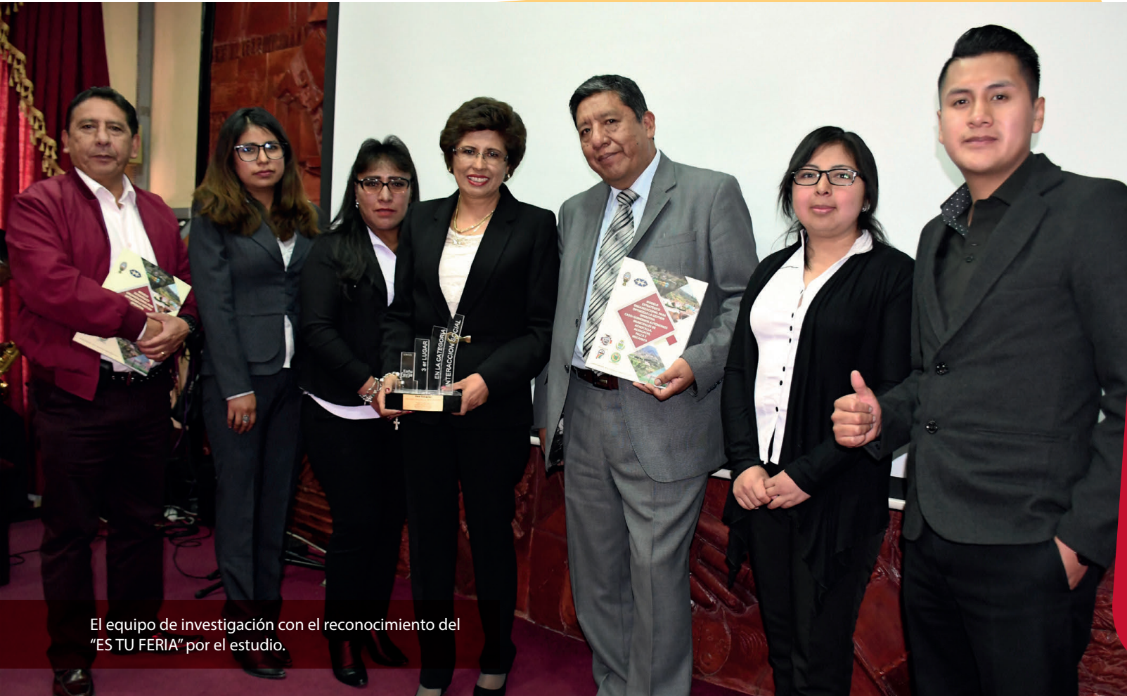
El equipo de investigación con el reconocimiento del "ES TU FERIA" por el estudio.