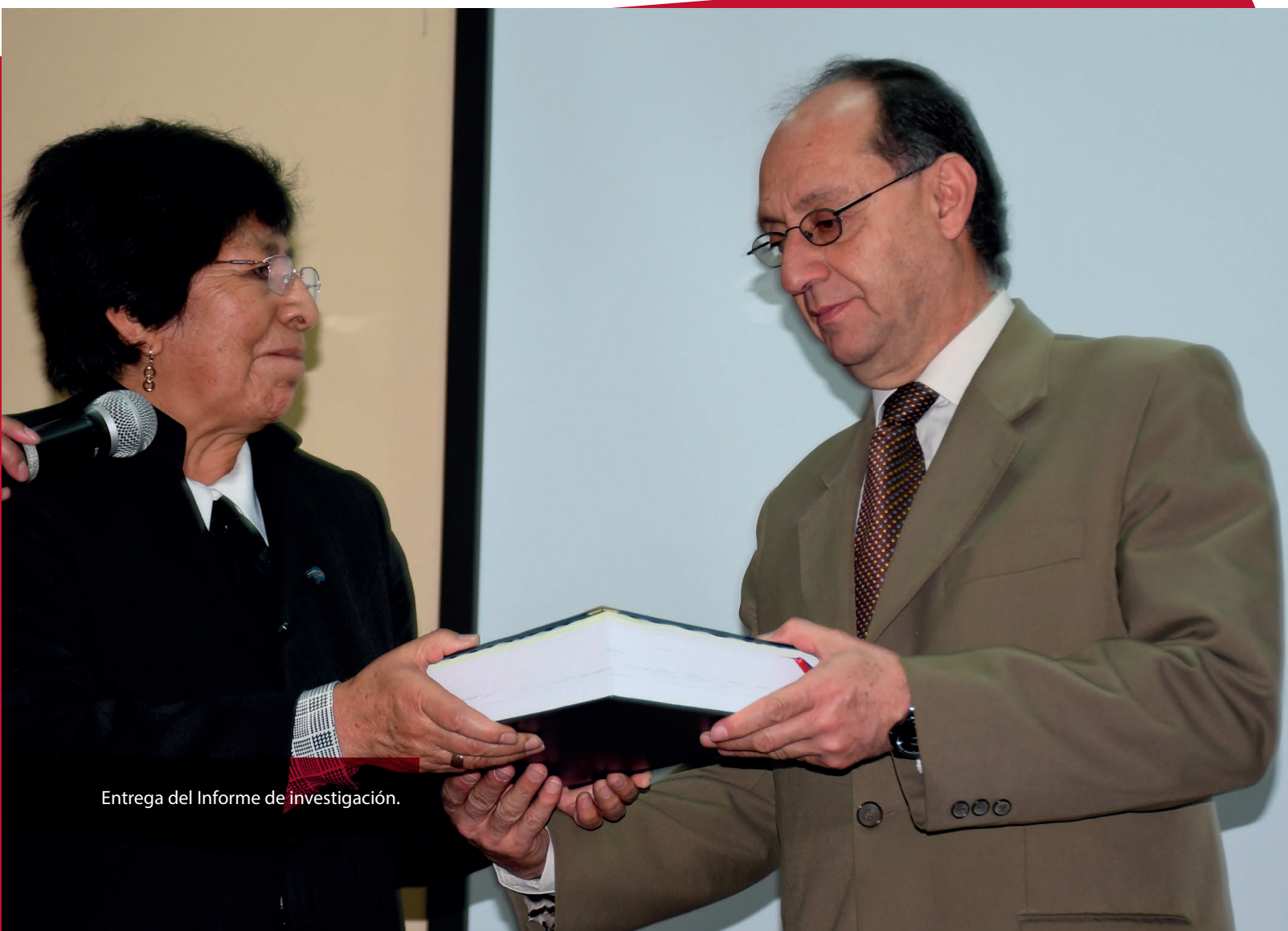
Entrega del Informe de Investigación.

La empresa privada ha descuidado la inversión en infraestructura y maquinaria aduciendo que el mercado no responde a las expectativas de generación de utilidades, por su tamaño, su nivel