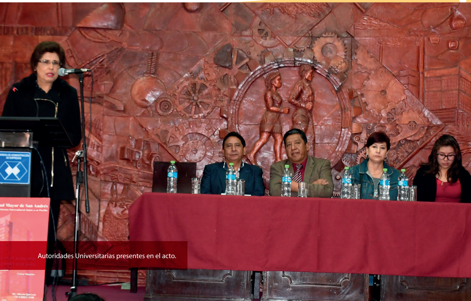
Autoridades Universitarias presentes en el acto.

En este mismo acto se realizó la entrega de certificados a otro grupo de estudiantes que realizaron un curso corto de costos por procesos.