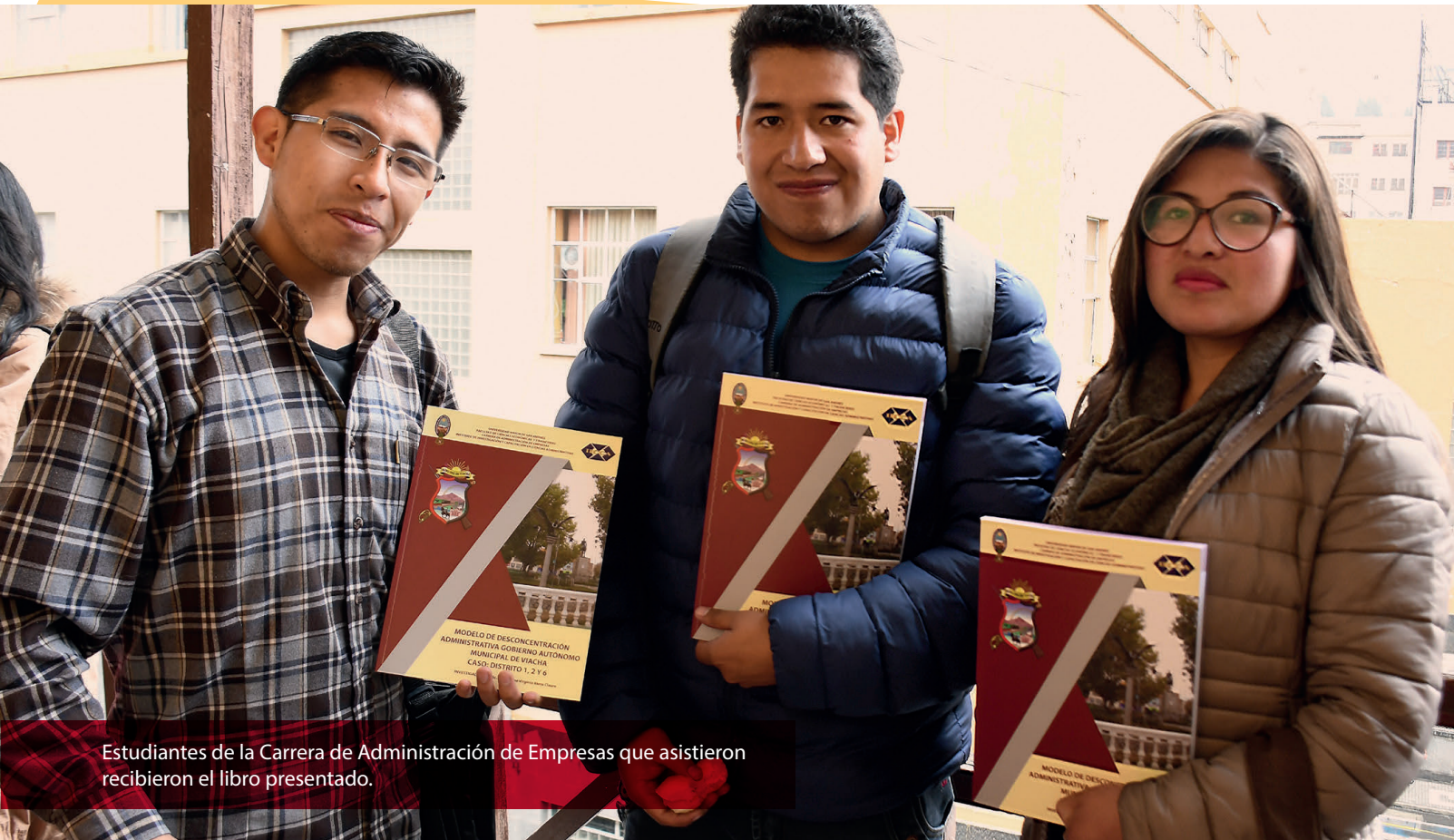
Estudiantes de la Carrera de Administración de Empresas que asistieron recibieron el libro presentado.