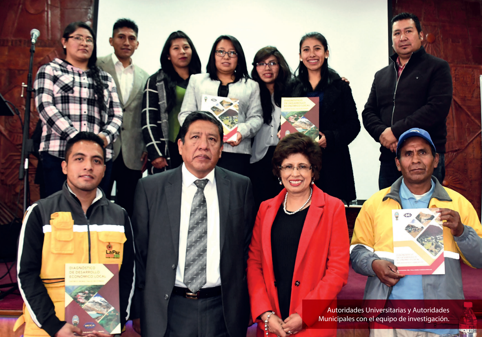
Autoridades Universitarias y Autoridades Municipales con el equipo de investigación.

Para el distrito rural del Valle de Zongo, se proponen 7 programas y 26 proyectos; para el macrodistrito de Hampaturi se proponen 8 programas y 20 proyectos. En todos estos se da prioridad a las vocaciones productivas en relación a la agricultura, ganadería y en algunos casos a la minería. Además, se añadieron propuestas de iniciativas turísticas para la búsqueda de mercados y capacitación en este rubro.