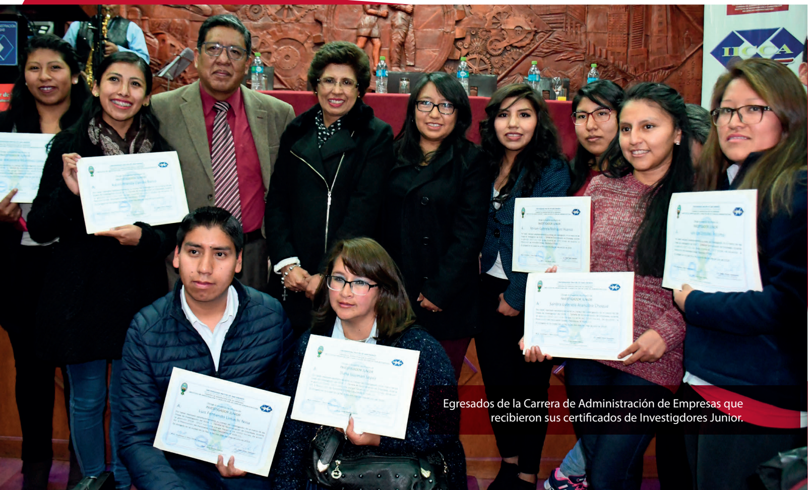
Egresados de la Carrera de Administración de Empresas que recibieron sus certificados de Investigadores Junior.

"Hace años decíamos que, como Carrera (de Administración de Empresas), nos estaba fallando incentivar la investigación en los estudiantes, por tanto teníamos que encontrar algún mecanismo donde puedan desarrollar un conjunto de habilites y destrezas. Es así que incorporamos a los estudiantes dentro las líneas de investigación del IICCA, de tal manera que paralelamente al estar haciendo su investigación, para titularse, contribuyan a la Universidad (UMSA) y a la sociedad", comentó el Decano de la Facultad de Ciencias Económicas y Financieras.